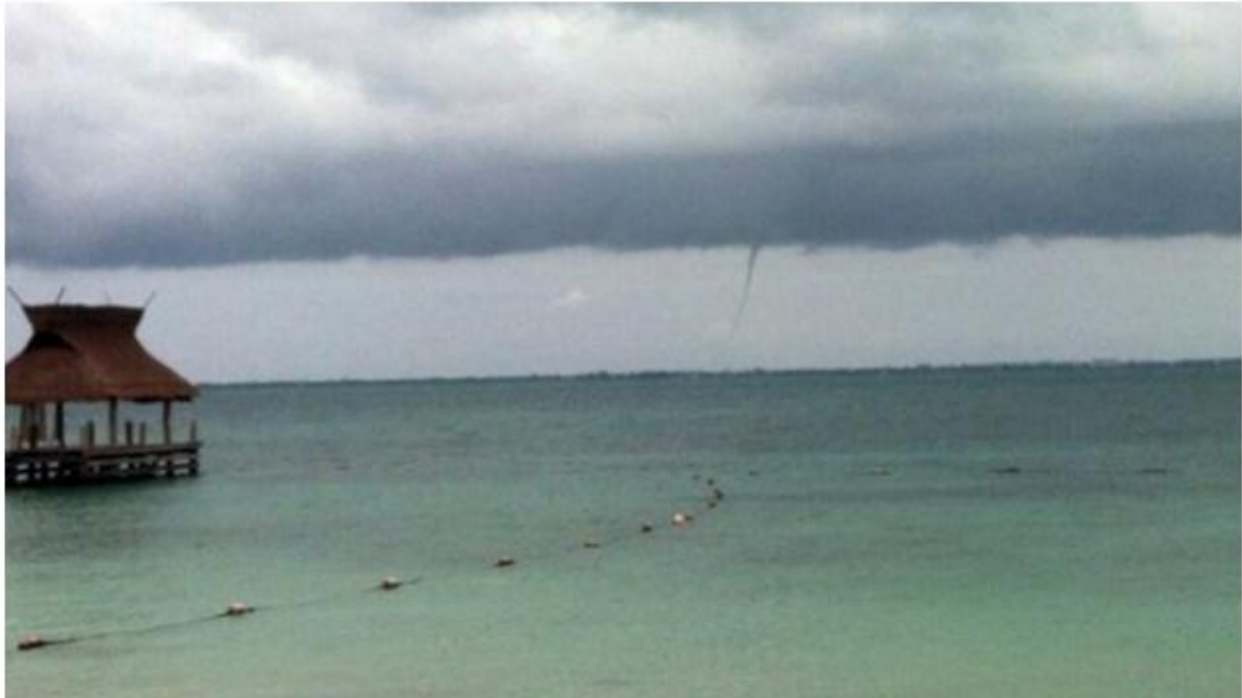
Fig.4. Tornado en Cancún.

Los habitantes de Cancún observaron el fenómeno el día 15 de enero, que no reportó afectaciones en tierra ni a pequeñas embarcaciones; varios usuarios de redes sociales confirmaron que se pudo apreciar en Puerto Morelos e Isla Mujeres (Fig. 4) (ElHeroico.com, 2014; La Verdad, 2014; Tabasco Hoy, 2014). Según el meteorólogo, en el 2011 se formó un pequeño “tornado” en la zona hotelera, que sólo fue posible ver en el territorio de mar, por lo que se toma como referencia en Protección Civil Municipal para supervisar este tipo de eventos asociados al tipo de nubes (cumulonimbus) (Yucatán All, 2014).