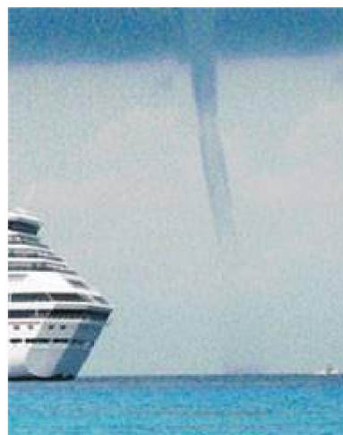
Fig. 3. Tornado en Cozumel, a un costado el crucero Carnival Conquest (Villegas, 2006).

El fenómeno meteorológico fue observado por miles de personas, visitantes y locales de la isla de Cozumel, comenzó formando un embudo hasta que tocó la superficie del mar, y se desplazó de un lado a otro en el canal de Cozumel. El evento ocurrió el día 3 de junio, alrededor de las 10:10 de la mañana y duró cuatro minutos, fue testigo el director de Protección Civil y mencionó que si este fenómeno hubiera alcanzado las embarcaciones pequeñas, éstas habrían sido volcadas por la fuerza del viento. Su formación correspondió a un día sumamente caluroso, pero el clima cambió de un momento a otro, trayendo un viento frío del norte que fue acompañado por una capa de densas nubes cargadas de humedad (Fig. 3) (Villegas, 2006).